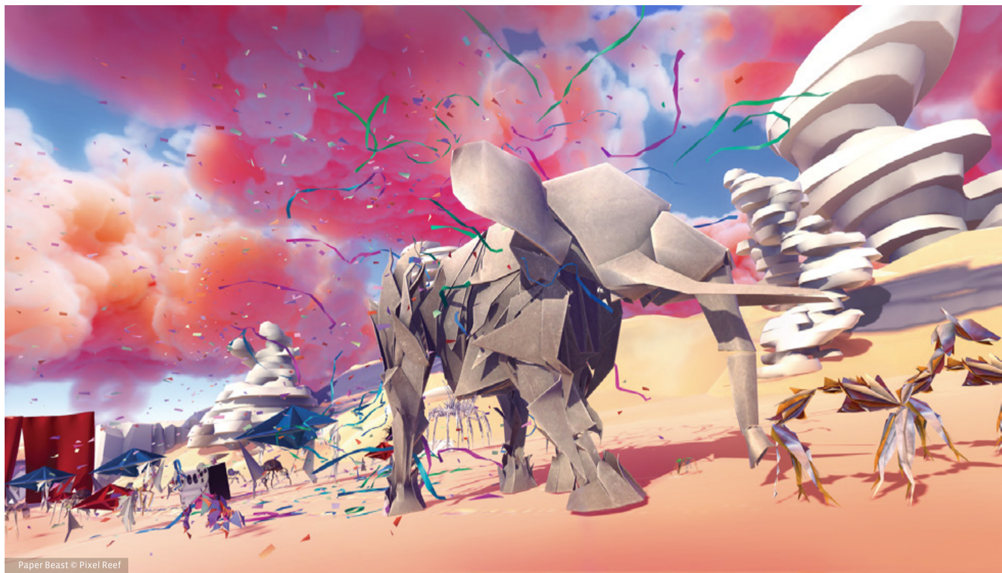
Paper Beast © Pixel Reef

2 (Master Image, Games and Intelligent Agents), 3 (Licence professionnelle Métiers du jeu vidéo), l'IUT de Tarbes (Licence Professionnelle Médias Interactifs, Applications Mixtes Immersives – MIAMI) et l'INU d'Albi (Master Audiovisuel, Médias Interactifs, Jeux – AMINJ).