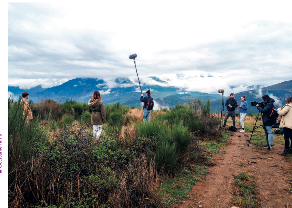
■ Occitanie films