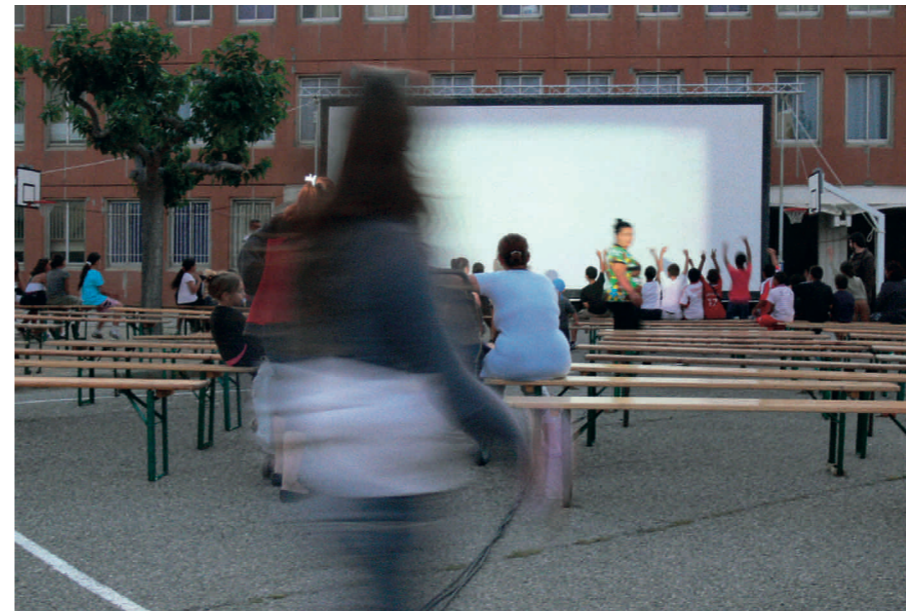
■ Occitanie films