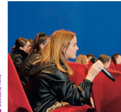
■ Occitanie films