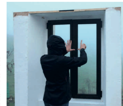
■ Les Films du Worso