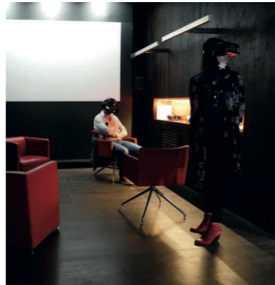
■ Occitanie films